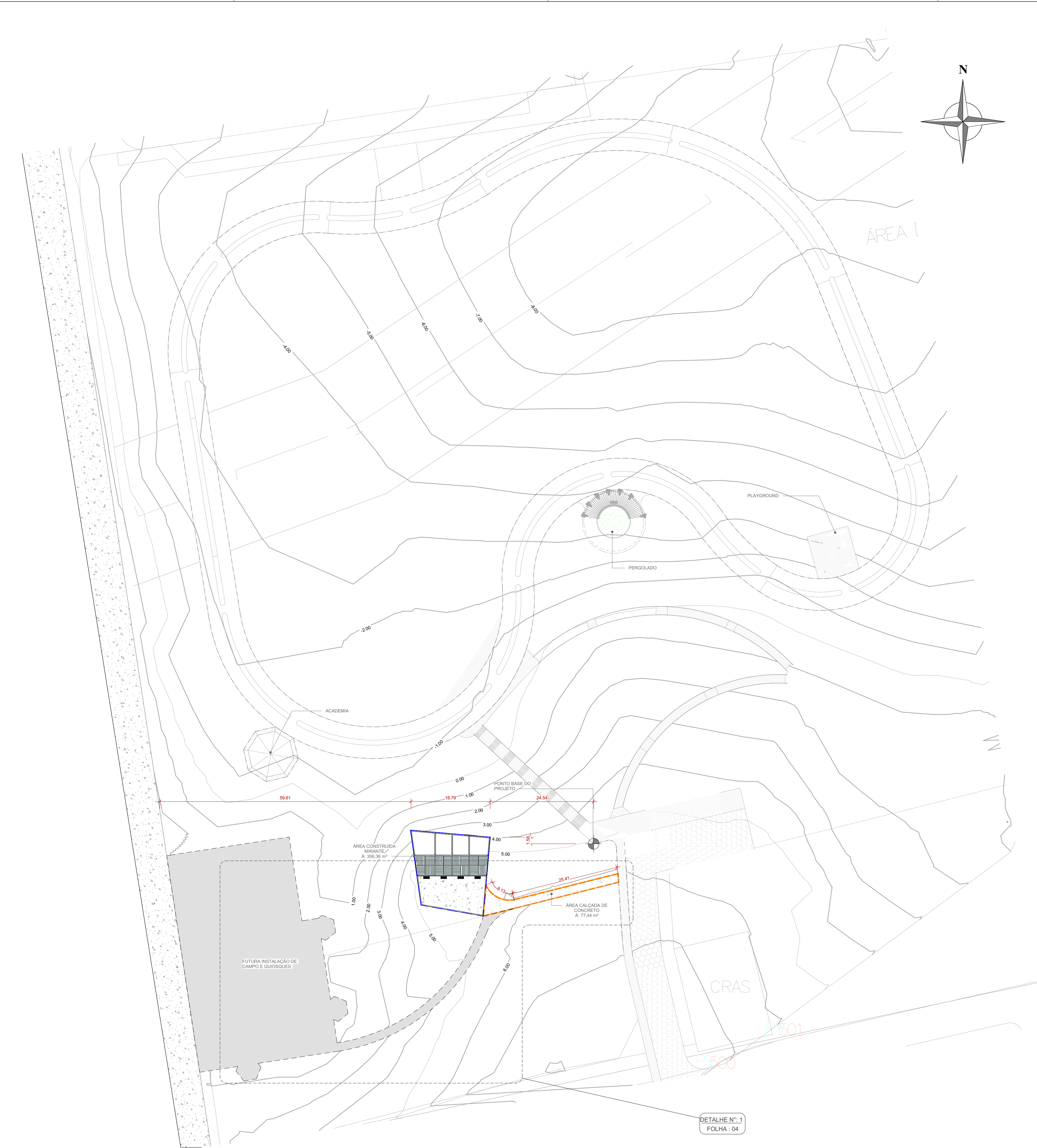
1 PLANTA DE IMPLANTAÇÃO 1 : 500